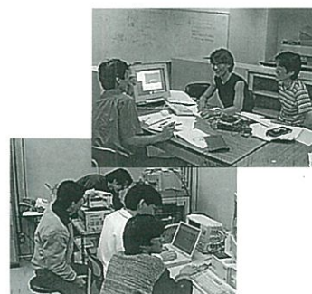
演習および実験風景

最後に、既に社会へ出てでがんばっておられる本学専攻出身のOB/OGのみなさんは、きっとその時の経験が活かされているものと確信しております。