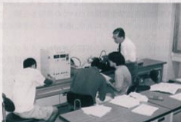
写真1 演習風景(試作部品の性能テスト)