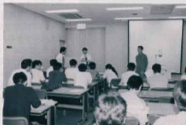
写真2 応用演習成果報告会